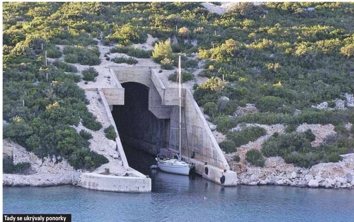
Tady se ukrývaly ponorky

Centrum Korčuly je nejzachovalším opevněným ostrovním městem Středomoří. Místo padacího mostu do něj vede schodiště z 19. století