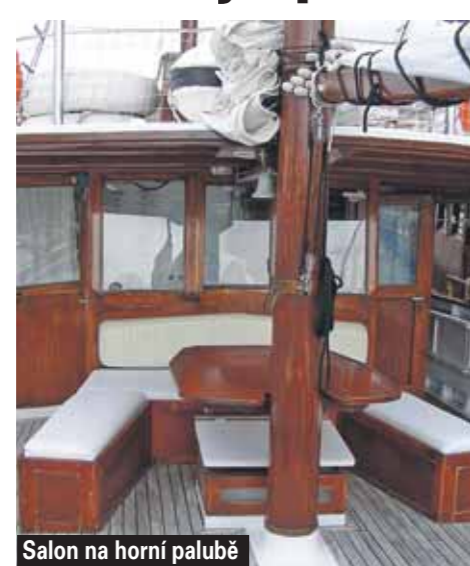
Salón na horní palubě

Jeho loď má dvě paluby, v podpalubí je deset dvouúložkových kajut. Salón, sprchy a toalety jsou na hlavní palubě. Posádku tvoří kapitán, kuchař a plavčík-strojník. „Největší výhodou mojí lodí je to, že je prostorná a má