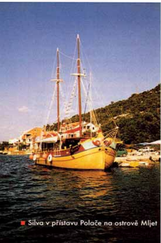
■ Silva v přístavu Polače na ostrově Mljet

paluby a hurá do terénu. Náš peloton se záhy rozdrobil na malé skupinky a jednotlivce. S mapkou v ruce však nemusel mít nikdo obavu, že se ztratí. Jako jediný z výpravy jsem měl silniční kolo – starého favorita, což omezovalo mé jízdní možnosti na asfaltky. Někteří majitelé horských kol si však líbovali v přírod-