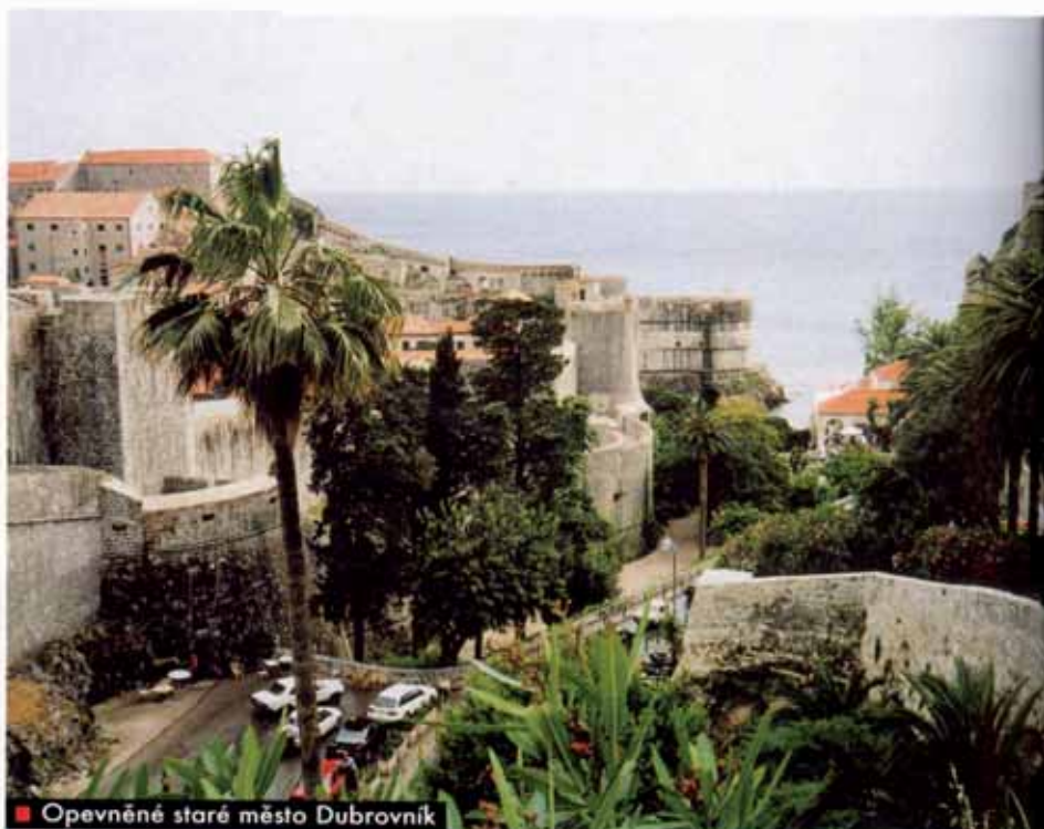
■ Opevněné staré město Dubrovnik