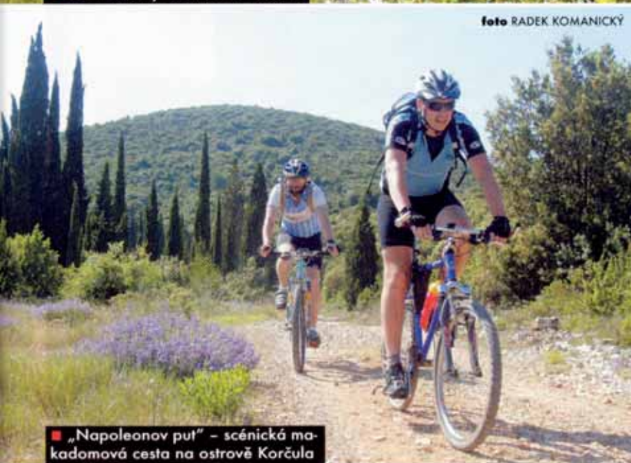
■ „Napoleonov put“ – scénická makadomová cesta na ostrově Korčula

měla být příjemná pláž. Dobře jsem udělal. Pobřežní komunikace skýtají hezký pohled na moře a vic stinných míst než někdy trochu fádni trasy po hřebenech. Pláž, na níž jsem potkal hned dvě skupinky z naší výpravy, za tu cestu opravdu stála. Užili jsme si bohatě nudistických radovánek a někteří z nás pak zamířili zpátky do Korčuly.