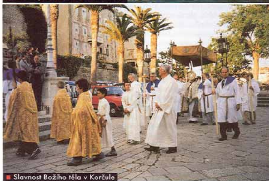
■ Slavnost Božního těla v Korčule