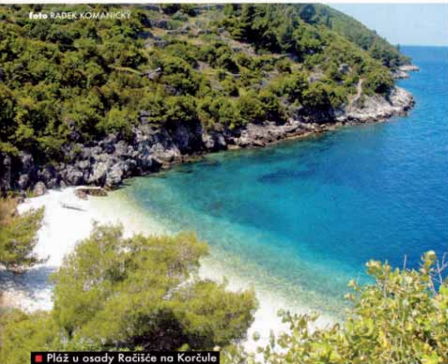
■ Pláž u osady Račišće na Korčule