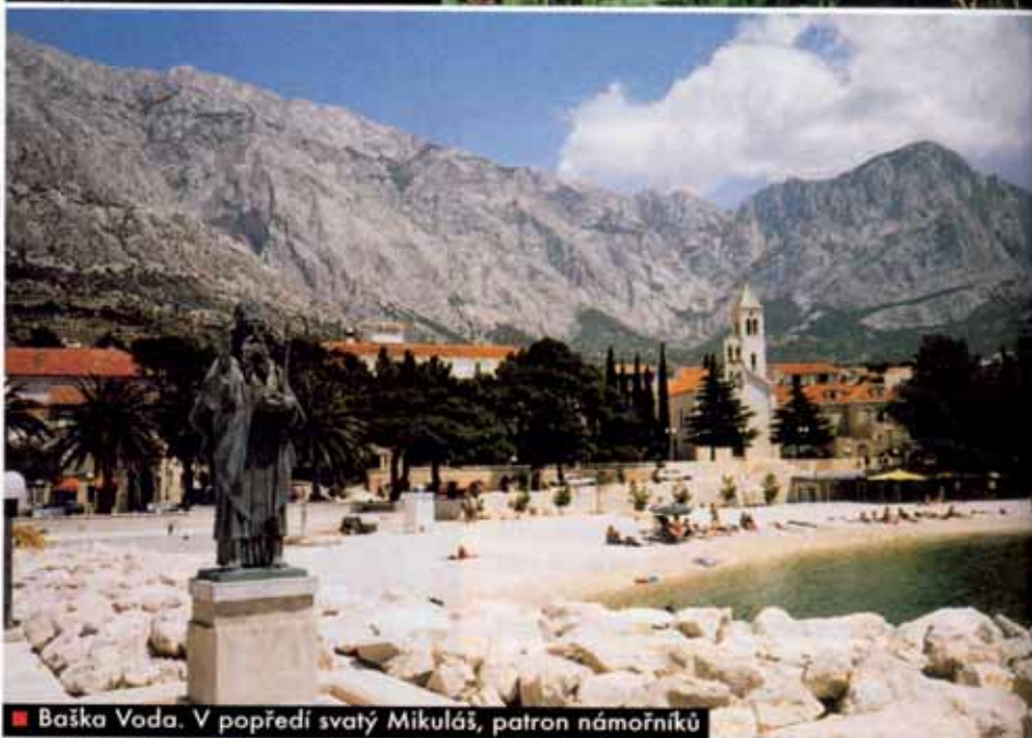
■ Baška Voda. V popředí svatý Mikuláš, patron námořníků

z výletu psát reportáž. Jako mnoho jiných Chorvatů pracuje jen v sezoně, přes zimu se vzdělává. Tak jsem se třeba dozvěděl, že zřícenina, na kterou se díváme z paluby zakotvené Silvy, je pozůstatek sídla, které si na ostrově kdysi postavil římský místodržící, a příležitostně mnoho dalších zajímavých útržků historických podrobností.