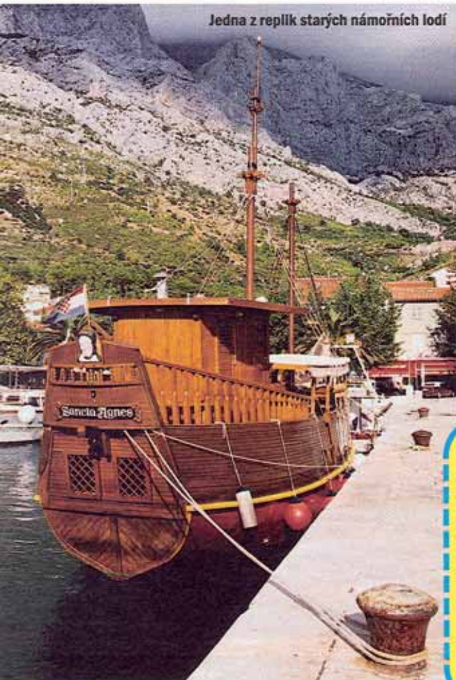
Jedna z replik starých námořních lodí

Psát o krásách Chorvatska je tak trochu nošením dříví do lesa. Ale zkusili jste někdy objevit půvaby téhle českými turisty mimořádně oblíbené země z paluby lodi?