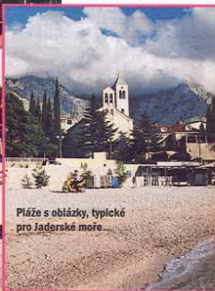
Pláže s oblázky, typické pro Jaderské moře

Kolo a loď Zajímavou možností je plavba s cykloturistikou. Jednoduše si s sebou vezmete kola, na která je na lodi dost místa. Ráno vyjedete s průvodcem po předem dohodnuté trase a odpoledne či večer dorazíte na místo, kam mezitím vaše loď připluje. Bližší informace o tomto způsobu trávení dovolené najdete na webu www.geotour.cz/s