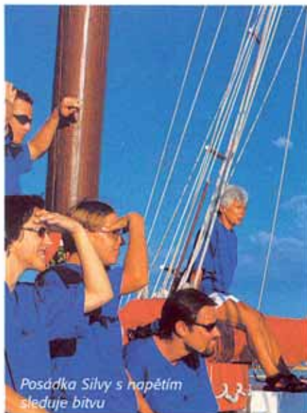
Posádka Silvy s napětím sleduje bitvu