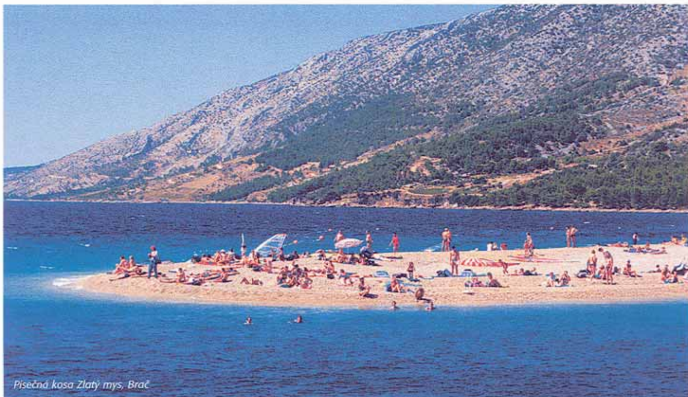
Písečná kosa Zlatý mys, Brač

Pola z Benátek až k císařskému dvoru do Číny, kde Polo ve službách Kublajchána setrval sedmnáct let. Po návratu se právě tady, před Korčulou, zúčastnil roku 1298 námořní bitvy mezi Janovany a Benátčany. Janované získali s vítězstvím tisíce zajatců, mezi nimi i Marca Pola. Stojí za připomenutí, že právě ve vězení nadiktoval později tolik oslavovaný kupec Rustichellimu z Pisy vše, co prožil. Rukopis vyšel pod názvem Milion a stal se nejznámějším cestopisem všech dob. Dlouho sloužil jako důležitý podklad pro sestavení mapy tehdejšího světa.