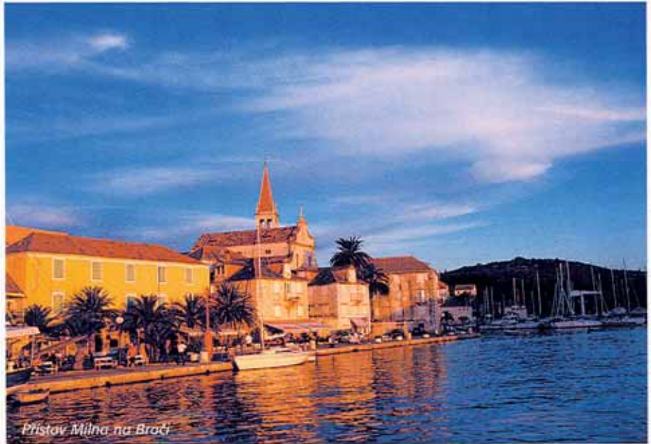
Přístav Milna na Brači