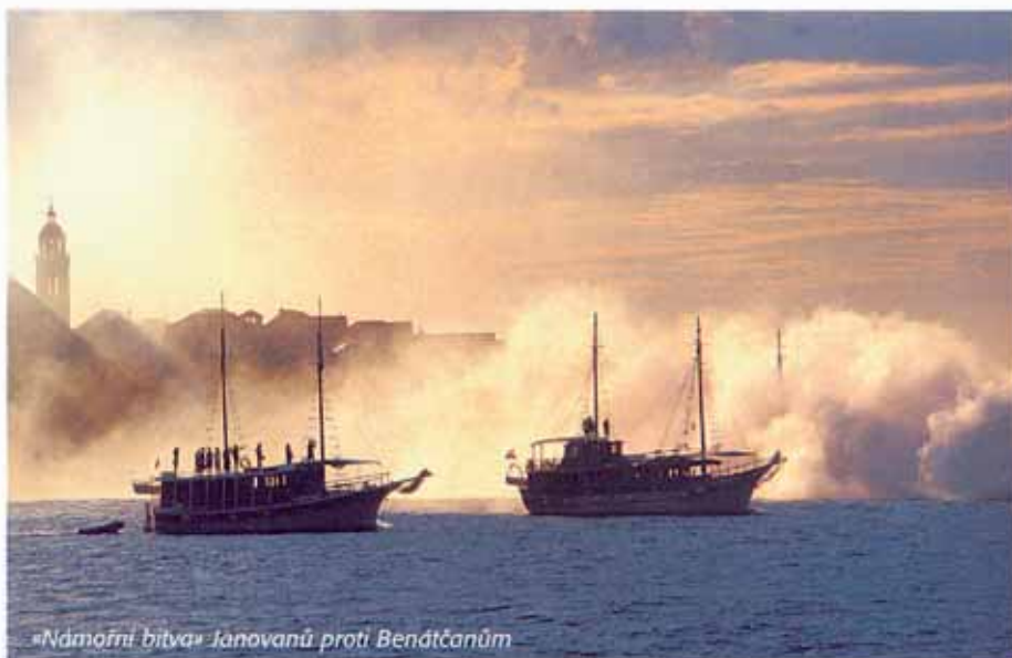
«Nadmorní bitva» Janovanů proti Benátčanům

niků hledáme uvnitř oltární obraz znázorňující patrony Korčuly – sv. Marka, sv. Bartoloměje a sv. Jeronýma, jehož autorství se připisuje Tintorettovi.