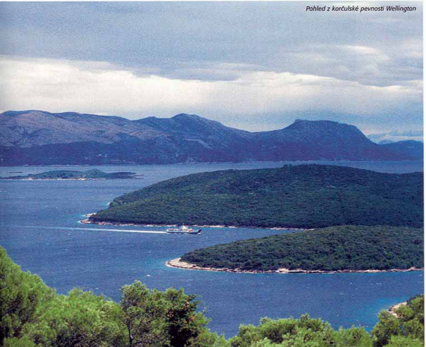
Pohled z korčulské pevnosti Wellington