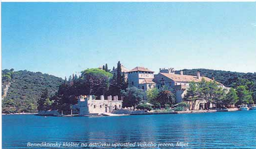
Benediktinský klášter na ostrůvku uprostřed Velkého jezera, Mljet

nu. Konečně nám dochází, že romantická plavba začala.