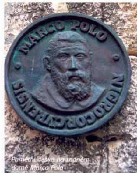
Pamětní deska na indonéském ostrově Marica Pola