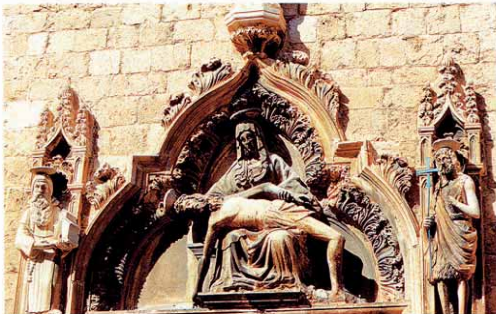
Portál kostela uvnitř dubrovnické pevnosti