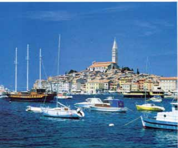
Starobylé městečko Rab zve na výlet do historie (nahore a dole), liduprázdné kornatské ostrovy rozdrobené podél chorvatského pobřeží zase přitahují milovníky tichého rozjímání (vpravo)