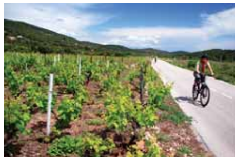
Až pojedete do Chorvatska, nezapomeňte kolo. Ideální je konec dubna až květen nebo září až říjen. Dá se jezdit na kole i koupat.

Malebné městečko Jelsa je unikátní tím, že je centrem největší náboženské slavnosti na ostrově Hvar. Toto procesí zvané „Za Křížem“ se odehrává v šesti hvarských městech (Kromě Jelsy ještě Pitve, Svirče, Vrisnik, Vrbanj a Vrboska) během velikonočního svatého týdne. Z každého městečka vychází samostatný průvod, v jehož čele nese jeden muž 18 kg vážící kříž. O tuto čestnou funkci je značný