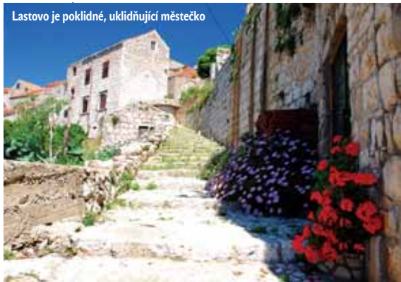
Lastovo je poklidné, uklidňující městečko

zájem, a proto není divu, že je pozice na řadu let dopředu rezervovaná. Jednotlivé části se nesmí během předem pevně dané cesty potkat, jinak by celý ostrov čekaly neblahé události. V současné době se tato několik set let stará tradice uchází o zápis na seznam světového kulturního dědictví UNESCO.