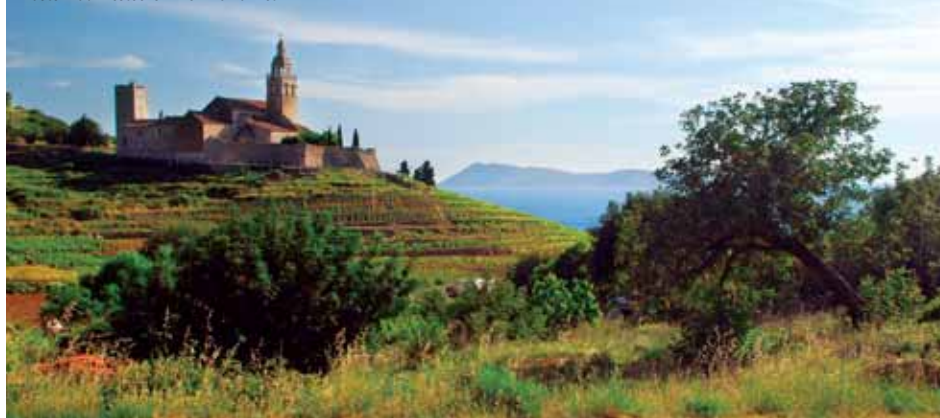
Kláster nad městečkem Komiza na Visu

zájem, a proto není divu, že je pozice na řadu let dopředu rezervovaná. Jednotlivé části se nesmí během předem pevně dané cesty potkat, jinak by celý ostrov čekaly neblahé události. V současné době se tato několik set let stará tradice uchází o zápis na seznam světového kulturního dědictví UNESCO.