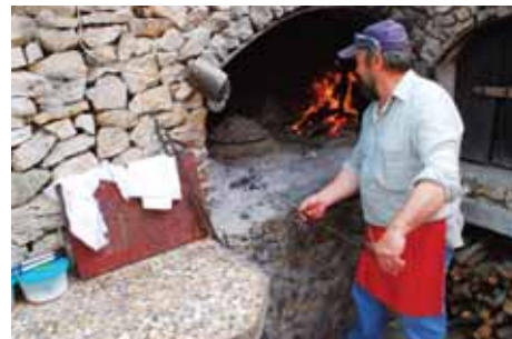
V rodinných restauracích se vaří ze zaručeně domácích surovin. Podává se jen to, co se zde vypěstuje, uvaří nebo uloví.