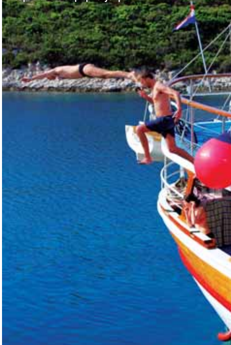
Koupání daleko od přeplněných pláží

Po přeletu na letiště ve Splitu následoval transit do městečka Trogir, kde už na nás čekala tradiční dřevěná oplachtěná loď, typická pro Jaderské moře.