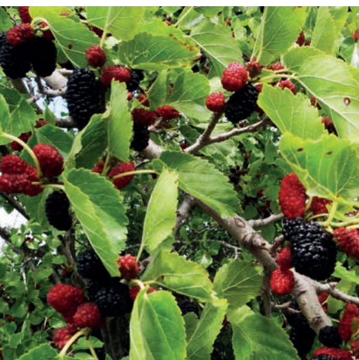
Plody moruše byly na konci května už krásně černé a sladké