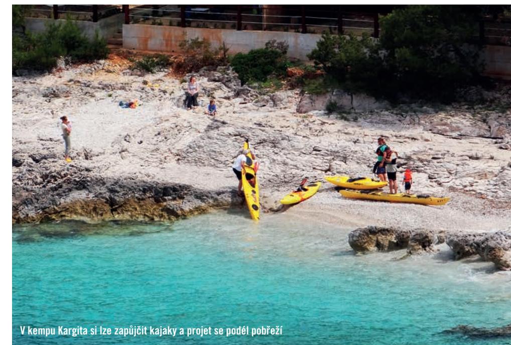
V kempu Kargita si lze zapůjčit kajaky a projet se podél pobřeží

bude určitě zajímavé poznávat členitou zátoku i pobřeží poloostrova. Ticho, klid, pěkné moře, romantika majáku činí ze zátoky místo na rozjímání i útočiště před civilizací.