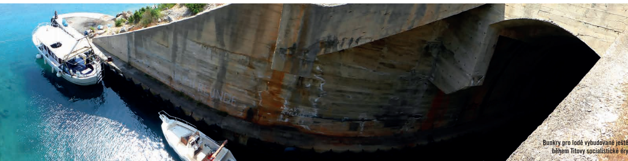
Bunkry pro lodě vybudované ještě během Titovy socialistické éry