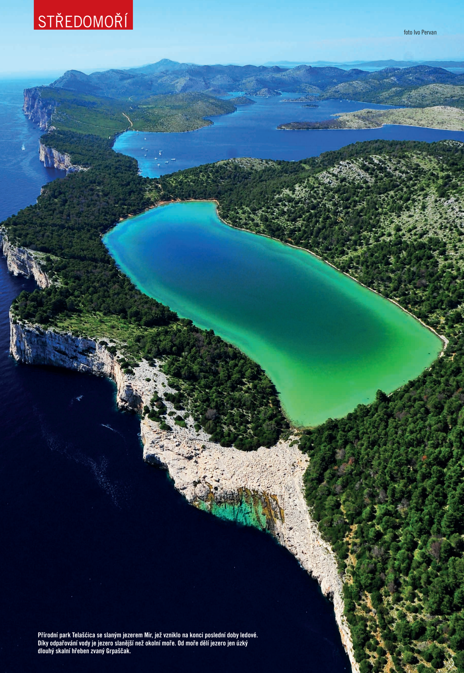
Přírodní park Telašćica se slaným jezerem Mir, jež vzniklo na konci poslední doby ledové. Díky odpařování vody je jezero slanější než okolní moře. Od moře dělí jezero jen úzký dlouhý skalní hřeben zvaný Grpaščak.