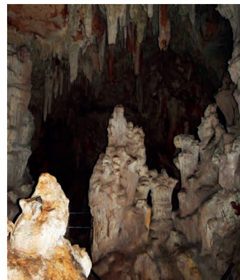
Jeskyňě Strašna peč byla při našem příjezdu zavřená. Nezbylo než přelézt mříž. Krápníková výzdoba však celkem stála za to.