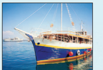
Aerobik s vůní pryskyřice a moře

M/S TVRDI je motorová plachetnice postavená v roce 1947, byla rekonstruována v roce 2002. Délka lodí je 27 m, šířka 6,5 m, vyšší ze dvou stěžňů má 18 m. Loď má tři paluby, salon a podpalubí. Kajuty třídy A jsou na první palubě, kajuty třídy B v podpalubí. Loď je vybavena pro pobyt 40 osob. Posádku tvoří kapitán, kuchař, strojník - stevard a plavčíci - stevard. Výhodou lodí je velký prostor v salonu a na palubách. I kajuty jsou relativně velké.