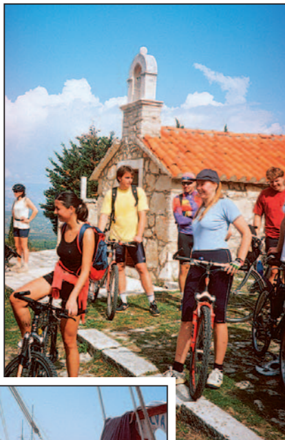
Na jedné z mnoha vyhlídek - Vrisnik, ostrov Hvar