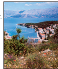
Květový Brač (Povlja)