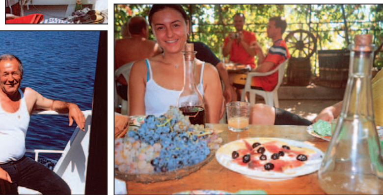
Fajnové barvy v "domácí hospodě" na Visu