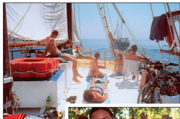
Na horní palubě Silvy při plavbě mezi Visem a Korčulou