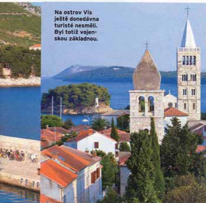
Na ostrov Vis ještě donedávna turisté nesměli. Byl totiž vojenskou základnou.